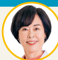
はたの君枝 前衆院議員