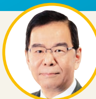
志位和夫 党議長・衆院議員