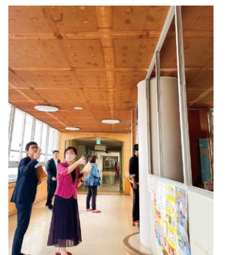
特別支援学校 廊下が図書室代わり▶

障害をもつ子どもたちが通う特別支援学校(特支)。教室不足で子どもも先生もつらい思いをしています。国の調査では、県内での音楽室や図書室の転用、一つの教室を2クラスで使う「合同使用」は287に上ります。ところが今年度までに解消するのは7教室。県の計画では足りません。既存校も昨年4月からの設置基準の水準をめざすとともに、特支の新設を迫りました。