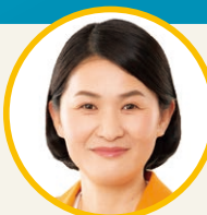
さいとう 和子 元衆院議員