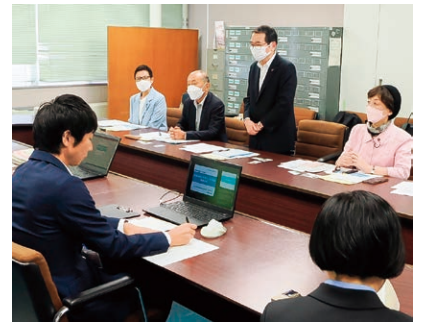
▲賃金引き上げ支援で岩手県視察

実質賃金は26カ月連続マイナスです。岩手県では時給50円以上賃上げした中小零細企業に、従業員一人あたり5万円を支給。県独自に14億6千万円を投入しています。 千葉県でも法人事業税の超過課税を実施すれば最大248億円の財源が確保できると指摘しました。県は「慎重な検討が必要」と消極的な姿勢でした。